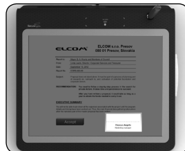
Diskrétny filter (voliteľné)